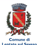
Comune di Lentate sul Seveso